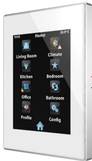
Zennio Z41 Touchpanel