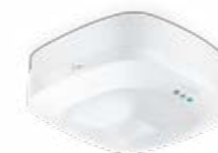
Utenpåliggende versjon (AP)